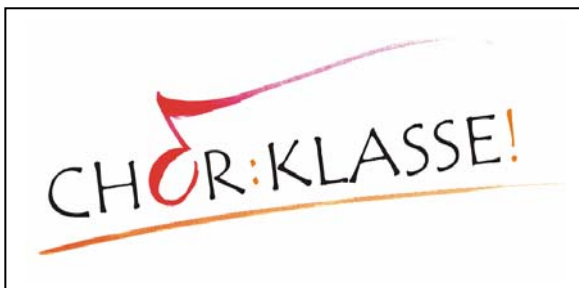
Abbildung 3: Chorklassenlogo