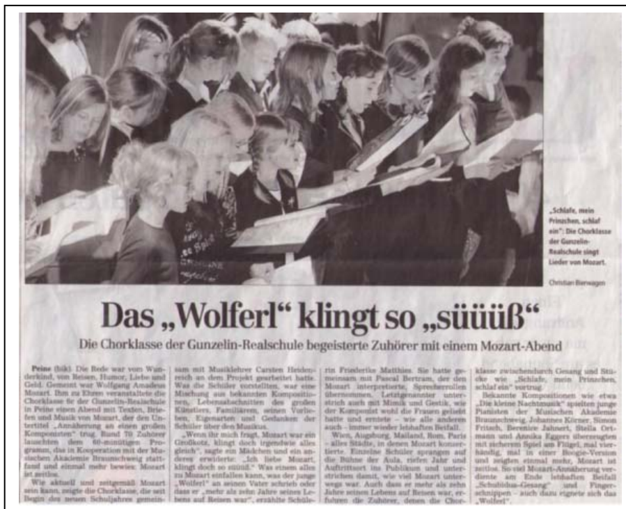
Abbildung 5: Peiner Allgemeine Zeitung, 04.12.2006