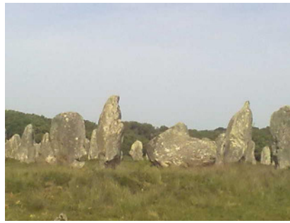
Menhire von Carnac