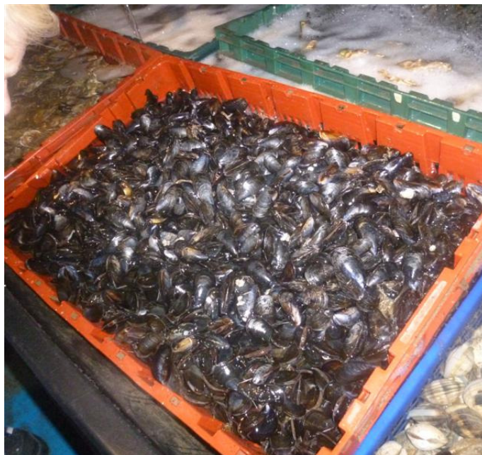
Besuch einer Muschelzucht