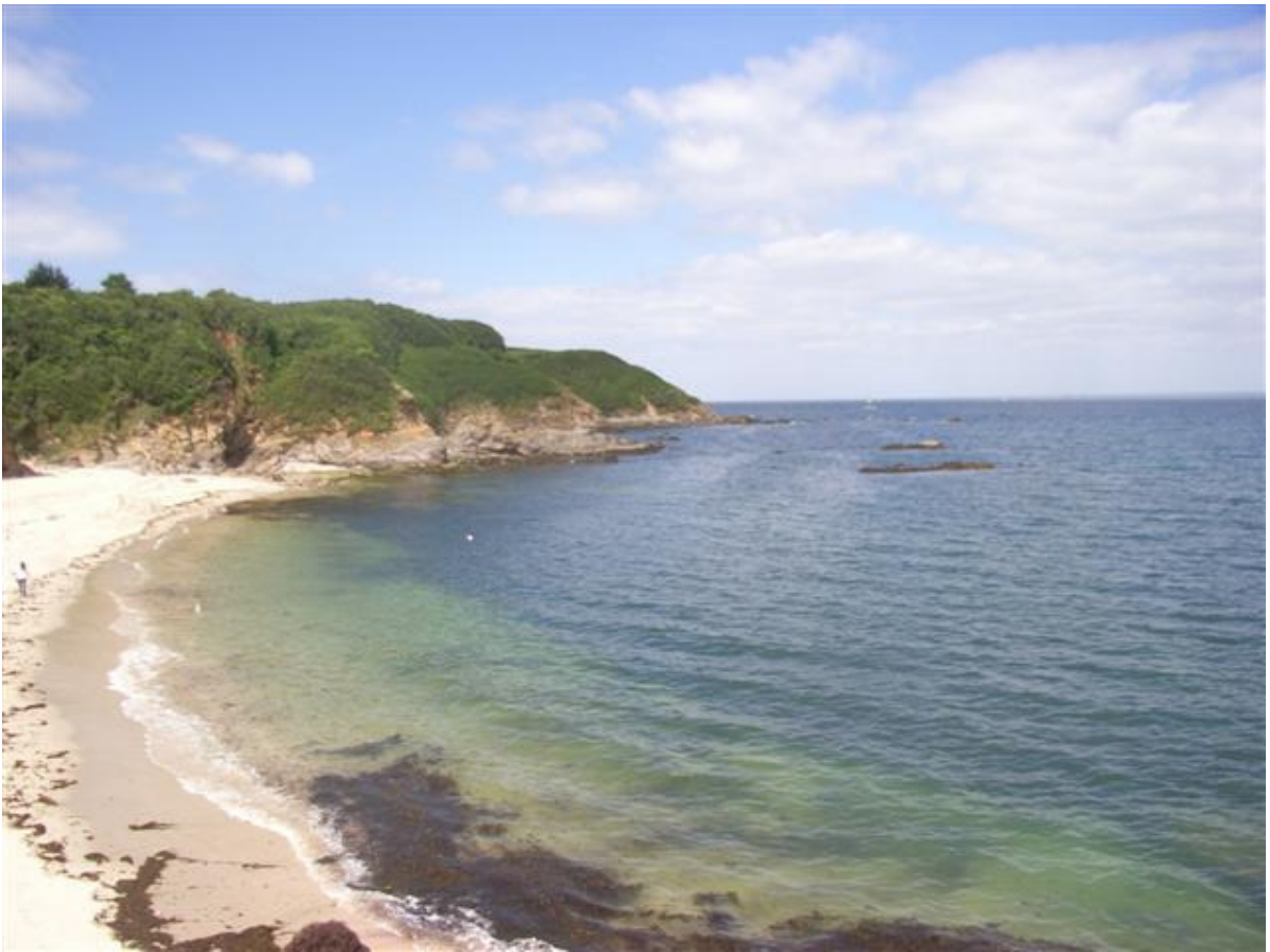
Strand auf der Île de Groix