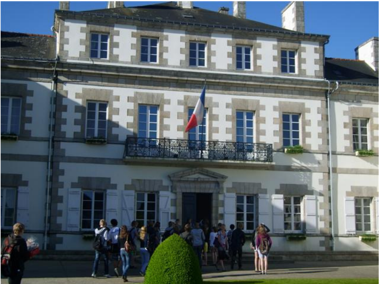
Empfang im Rathaus von Pontivy