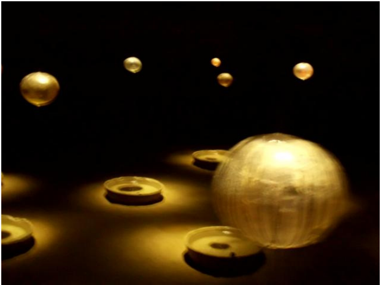
Ausstellung im Schlossturm