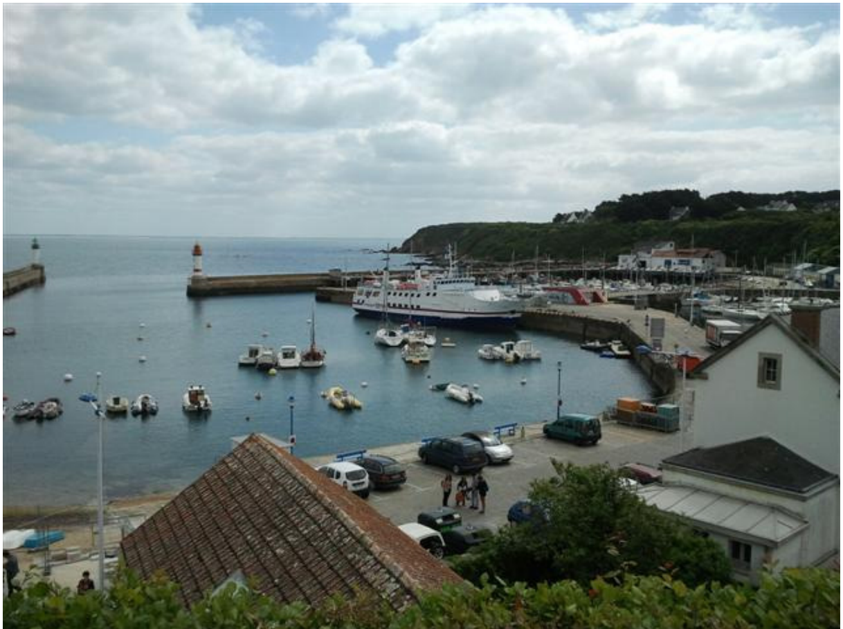
Hafen der Île de Groix