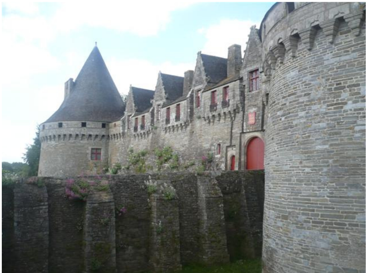
Schloss von Pontivy

de leur séjour, ils ont visité Pontivy, Lorient, Port-Louis, l'île de Groix, où ils ont rencontré un ostréiculteur. Une visite de la biscuiterie Joubard, à Pontivy, était au programme de leur séjour. Il s'agit de la seconde année d'échange entre le lycée de Friesoythe et celui de Joseph-Loth.